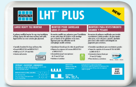
Data Sheet 109.0